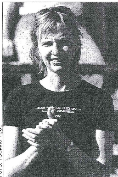
Personalijuhi Kadrin Pintsoni sõnul on eelmise aastaga taastunud sihipärane koolitus.

2002. aasta koolituse täpsem ülevaade on üleval ETV intranetis personali- dokumentide all.