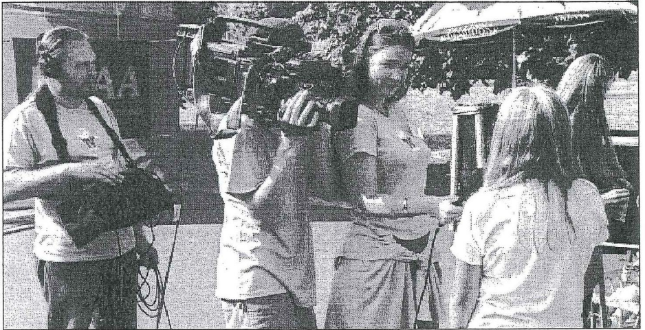
Käesoleva aasta koolituse prioriteediks on meeskonnatöö koolitus saatemeeskonna liikmetele.