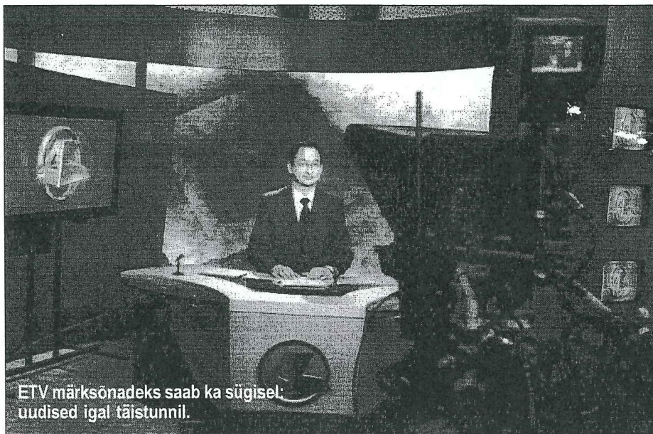
ETV märksõnadeks saab ka sügisel: uudised igal täistunnil.