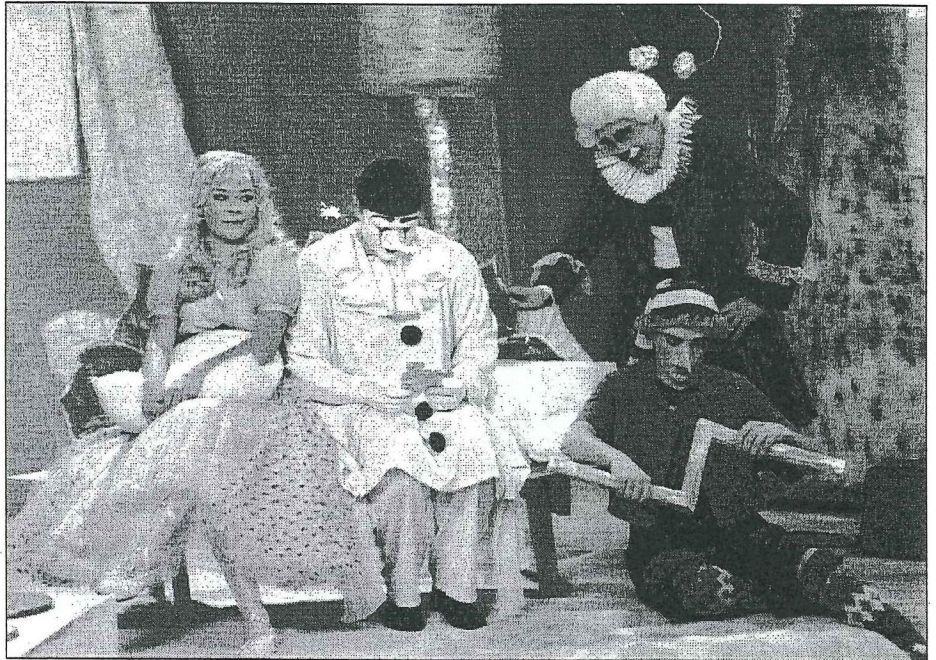
Sügisest jätkub sel hooajal lastelt ja nende vanematelt väga hea vastuvõtu saanud lastesaade "Buratino tegutseb jälle".

Õhtu nurgakivi on ka tuleval sügisel AK põhisaade. Selle järel jääb esmaspäeva struktuur samaks: pool tundi kohalikku huumorit ja siis Välisilma komplekt (saade + film). Teisipäevgi jätkab traditsiooni: OP, kohalik lühifilm ja väärtfilm – kõik kokku maiuspala kultuurinimesele. Kolmapäeval toimub väike muudatus: Viies stuudio asendub sisult sarnase ent loodetavasti dünaamilisema Foorumiga. Selle järgneb kas "Presideni meeskond" või "Sopranod", mille järel tuleb uus inimlugude dokumentaalfilmi slot. Neljapäeval